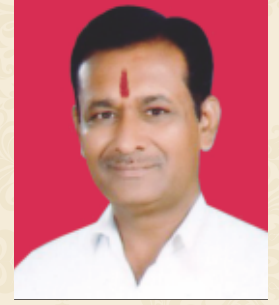
बब्रुवाहन उत्तेश्वर काशीद संचालक